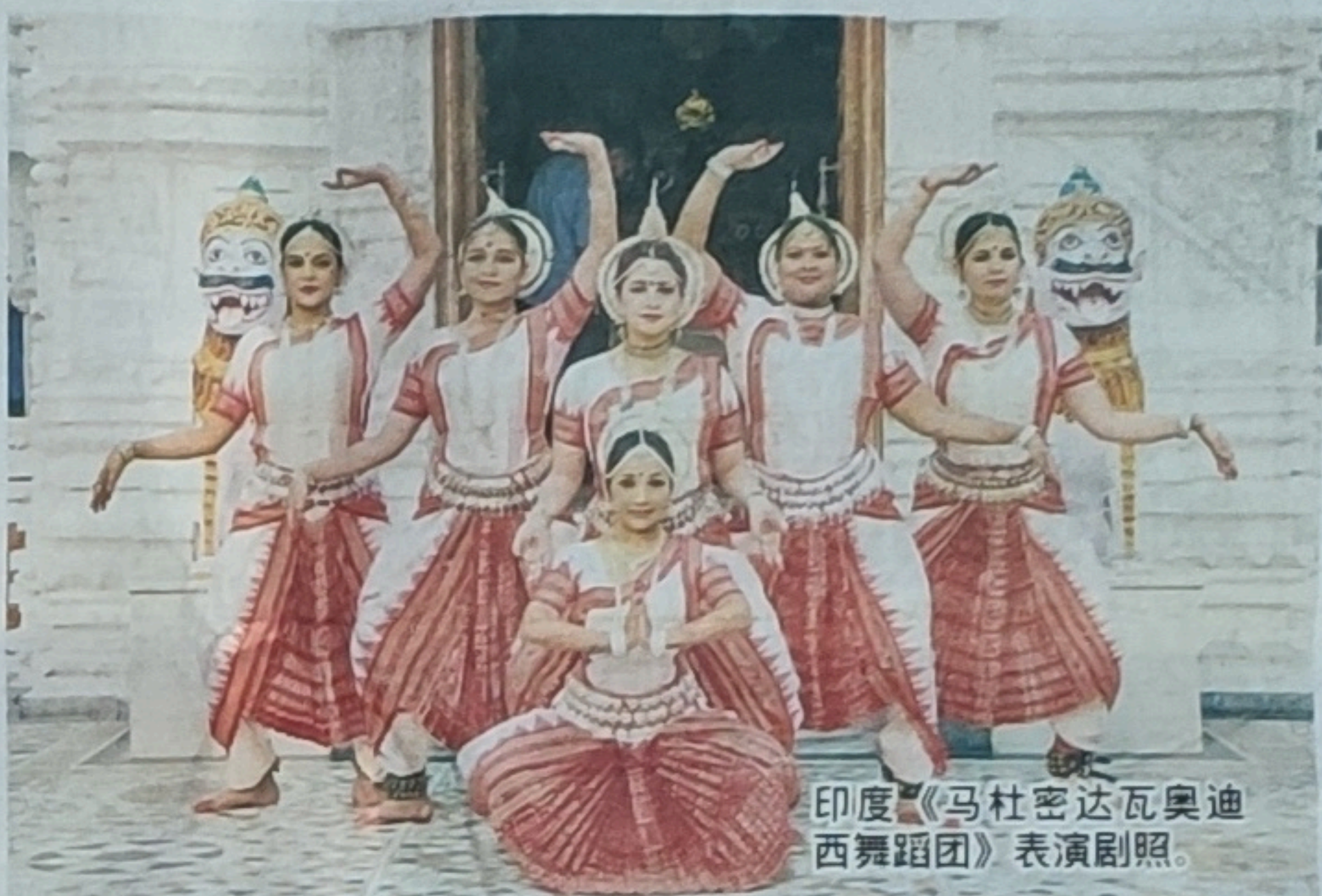
印度(马杜密达瓦奥迪西舞蹈团)表演剧照。