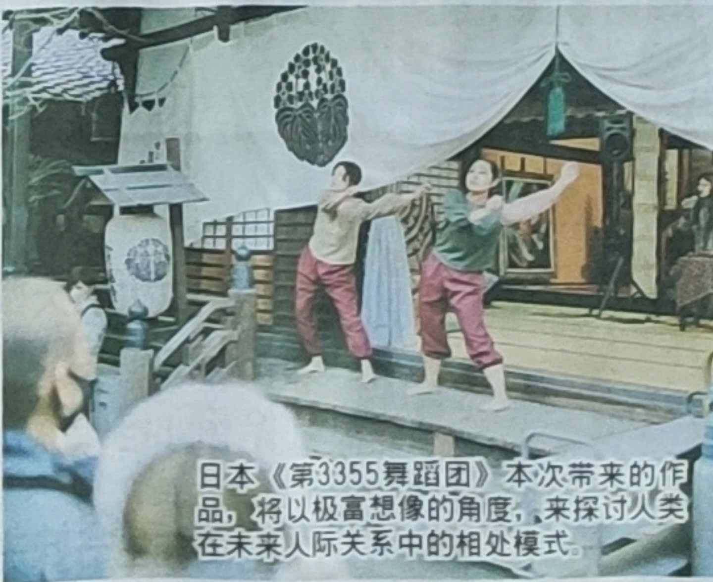
日本(第3355舞蹈团)本次带来的作品，将以极富想像的角度，来探讨人类在未来人际关系中的相处模式。