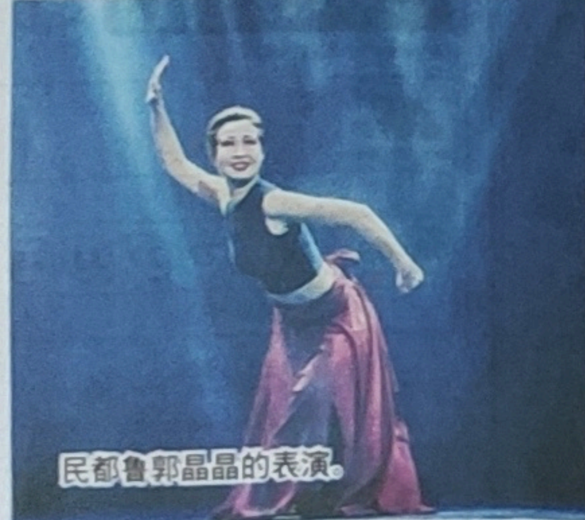
民都鲁郭晶晶的表演。