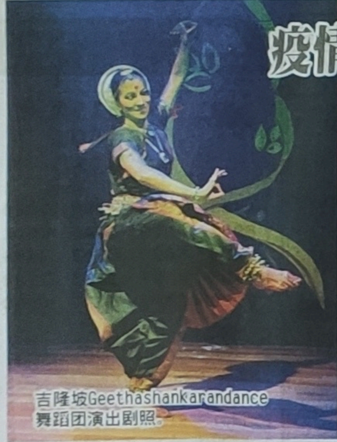
吉隆坡Geethashankarandance舞蹈团演出剧照。

菲律宾(名人舞蹈团)为颇具盛名的街舞团队，该团於2018年参与过国际舞蹈节，结合菲律宾传统舞蹈的街舞，让本地观众留下深刻印象。其创作的街舞曾在国际舞蹈比赛中，获奖20多次，表现亮眼。