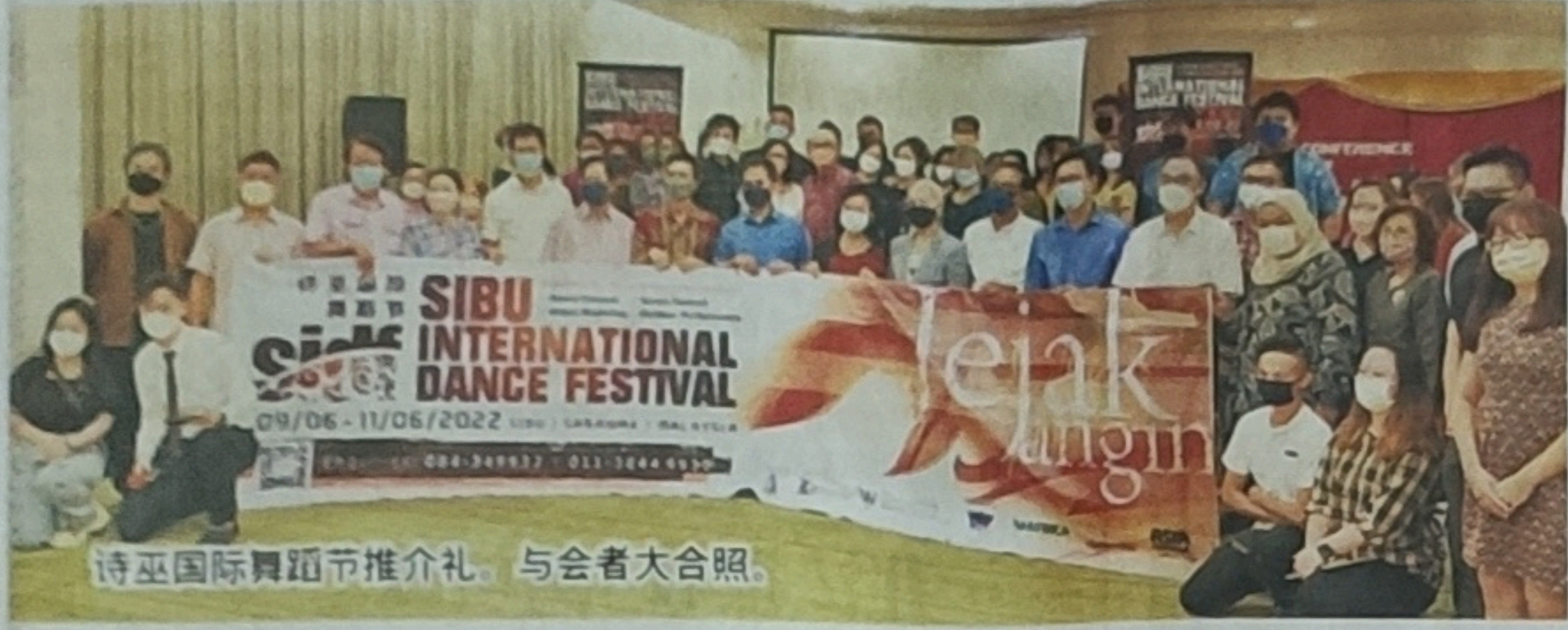
诗巫国际舞蹈节推介礼。与会者大合照。